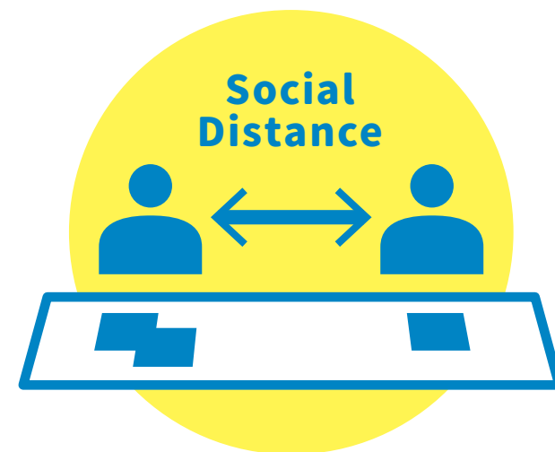
適切な間隔を空けた着席