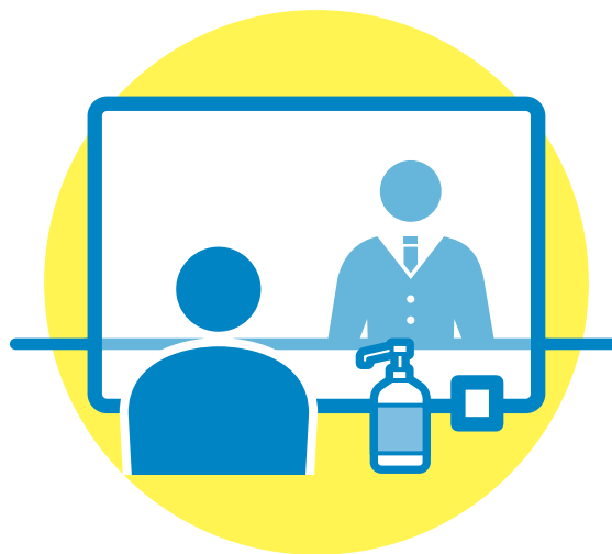
パーテーション等の設置