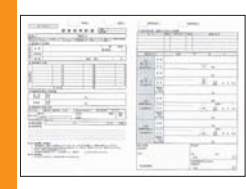
4 【契約書作成・契約金入金】