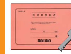
5 【鍵と契約書 の受領】