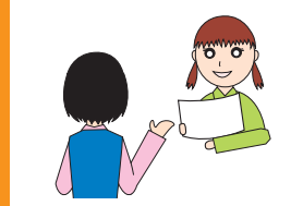
3 【重要事項の説明・契約書類発行】